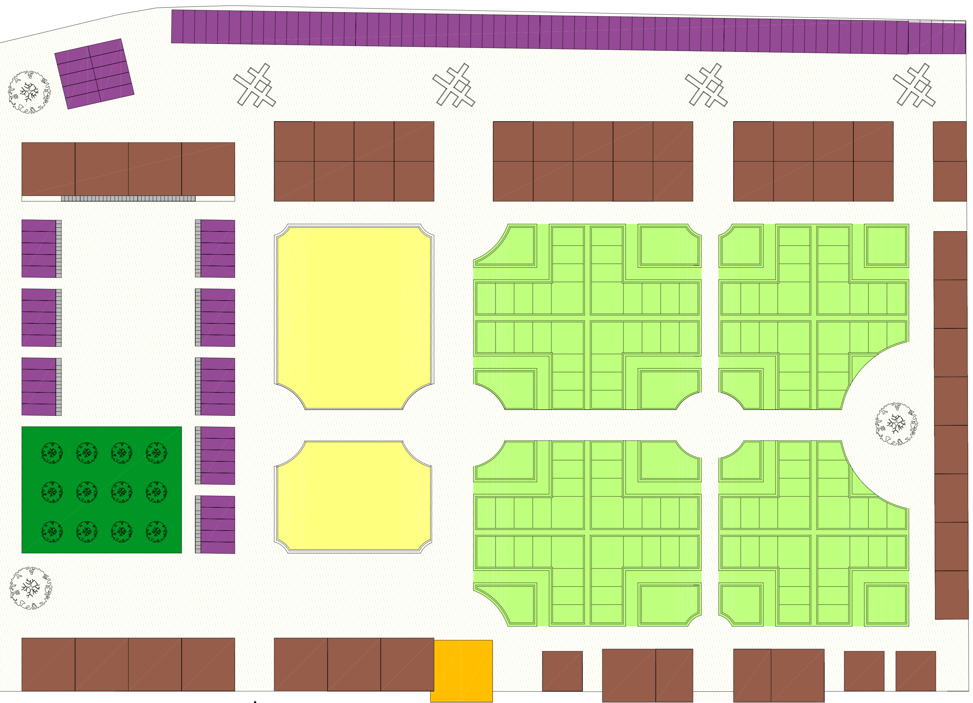
AREA CIMITERIALE IN AMPLIAMENTO